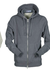
STEEL GREY MELANGE