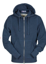
BLU DENIM MELANGE