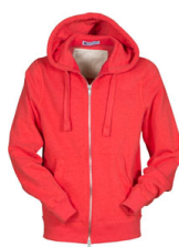
POPPY RED MELANGE