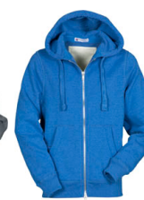
BLU ROYAL MELANGE