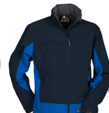
BLU NAVY/BLU ROYAL