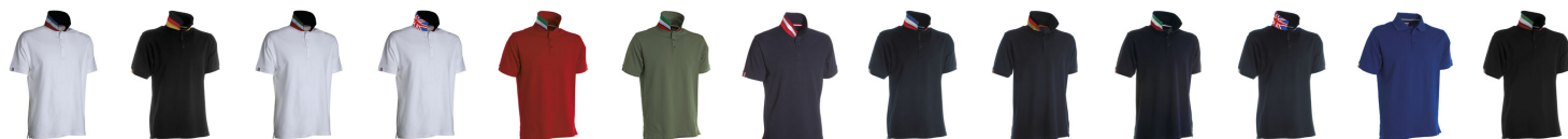
BIANCO/FRANCIA NERO/GERMANIA BIANCO/ITALIA A BIANCO/UK ROSSO/ITALIA A VERDE MILITARE/ITALIA BLU NAVY/AUSTRIA BLU NAVY/FRANCIA BLU NAVY/GERMANIA BLU NAVY/ITALIA BLU NAVY/UK BLU ROYAL/ITALIA